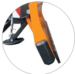
Aggressiver Anstellwinkel 25°