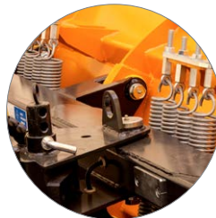
Drehpunkt für Schwenkung in Rahmenmitte