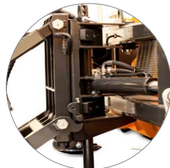
getrennte Hebe- & Schwenkeinrichtung