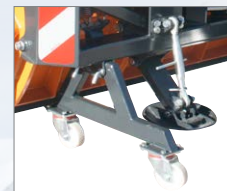
Abstellwagen zum einfachen Abstellen und Rangieren im abgehängenen Zustand