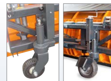
Laufrollen (Vollgummi oder Luftbereift)