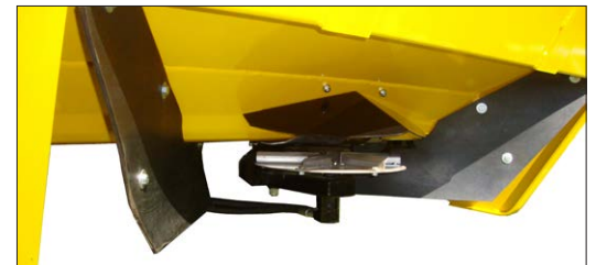
Streuteller mit Schutzgummi