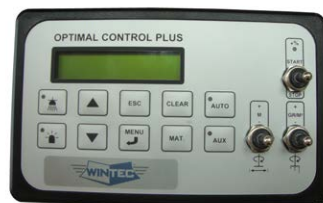
Control-Plus Bedienpult wegeabhängig