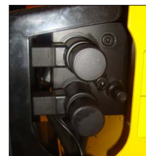
Hydraulikblock für manuelle Steuerung