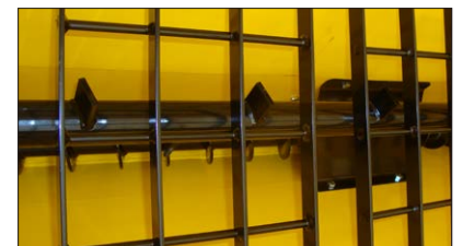
Dosierschnecke mit Umrührwelle und Gitter